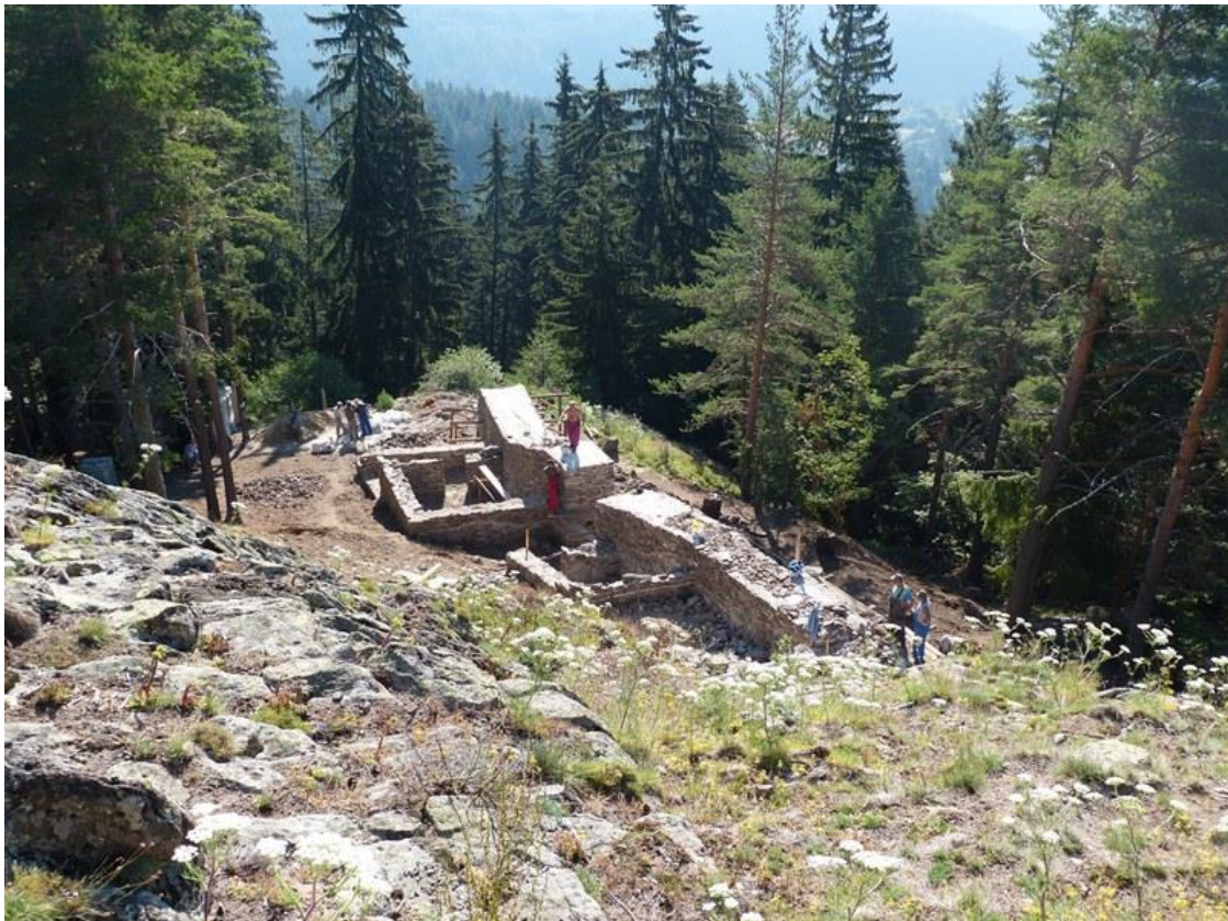
Обр. 2. Южната стена на крепостта в м. Турлука по време на консервационно-реставрационните дейности по проекта

През 2011 г. Община Смолян в партньорство с Община Самотраки – Република Гърция и Регионален исторически музей „Стою Шишков“ – Смолян, печели проект „Тракийско и византийско културно наследство в Родопите и Северното крайбрежие на Егейско море“ с акроним „THRABYZHE“ по програма за Европейско териториално сътрудничество Гърция – България – 2007-2013 г. В дейностите по проекта бе включено археологическо проучване на крепостта при с. Кошница и консервация и реставрация на разкритите структури на крепостите край Кошница и в м. Турлука над гр. Смолян и тяхната социализация.