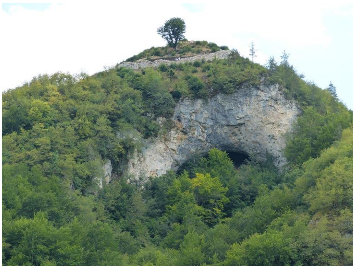
Обр. 4. Крепостта Калето край с. Кошница

аналогична с тази, откривана в средновековните пластове на другите крепости в Средните Родопи – Смолянската крепост, Момчилова крепост, Беденска крепост, Девинското градище [21, обр. 5 и 6]. Намериха се и други средновековни материали – върхове на стрели, една обеца и две монети. Едната е българска имитация тип А (1200-1204 г.) и латинска имитация тип В, сечена в Тесалоника. Тяхното отсичане продължава от началото докъм средата на 20-те години на XIII в. [28, 22-32].