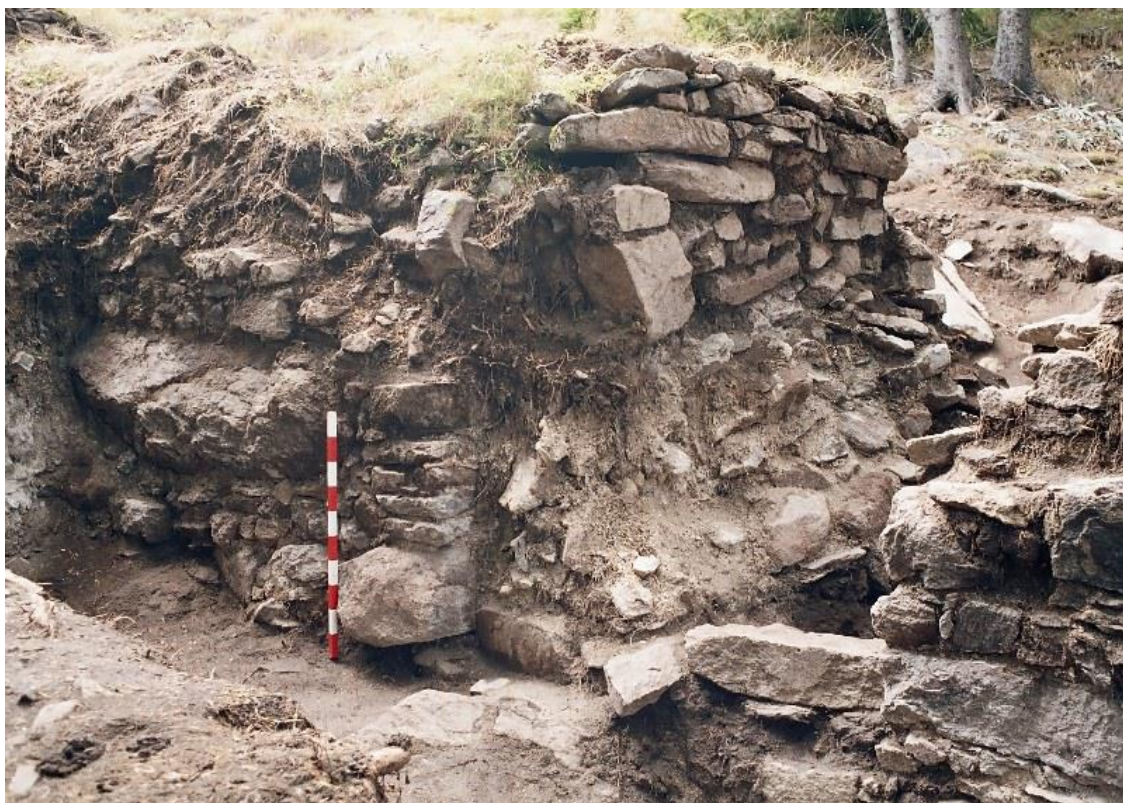
Обр. 3. Входът на средновековното укрепление, основан върху късноантичните руини

Досега от крепостта са проучени цялостно южната стена с прилежащите ѝ помещения, както и сектор от източната стена и североизточният ъгъл [20, Обр. 4]. Средновековният период на съществуване на Смолянската крепост отнасяме към края на X – средата на XIII в. При изграждането ѝ деструкциите от ранновизантийския кастил не са разчистени докрай. Стената на новото укрепление ляга директно върху старата куртина и засипаните помещения. Тя е с дебелина 2,40 м. Техниката на градеж е суха зидария. Явно средновековната крепост не е класическа военна, а укрепление, изградено набързо от местното население за самозащита [20, 39]. Вероятно такава нужда възниква след 70-те години на X в. и перманентните българо-византийски войни, водени от императорите Йоан Цимисхий (969-976) и Василий II Българоубиец (976-1025).